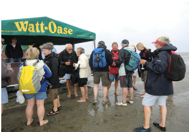
Rast an der Watt-Oase

marschieren. Unterwegs gab es mehrmals leichte, kurze Schauer, aber es ließ sich hervorragend laufen. Die Gruppe kam so gut voran, dass wir an der Watt-Oase eine kleine Pause einlegen konnten.