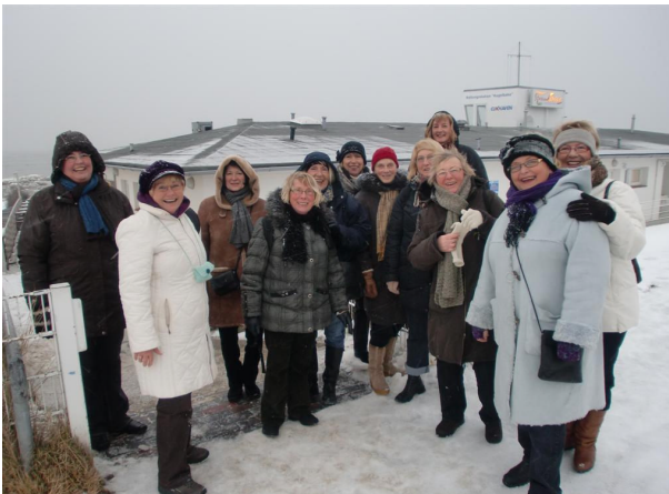
Die Damen beim winterlichen Ausflug in Döse