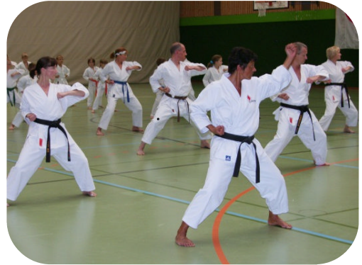
Auch Dans und Oberstufe wiederholen Grundschultechniken (Kihon)

In der Sporthalle der Berufsbildenden Schulen fanden sich mehr als 75 Karatesportler aus Cuxhaven und umzu, aber auch aus Rothenburg, Bremen, Hannover, Bayern und überall aus Deutschland ein, um mit dem ehemaligen Bundestrainer des Deutschen Karateverbandes (DKV) zu trainieren.