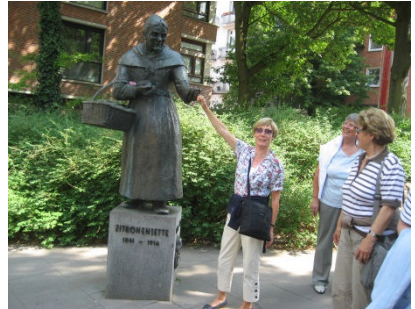
Die Zitronenjette in Hamburg

Am nächsten Morgen stand zunächst eine Fahrt mit der Hafenfähre nach Fin-