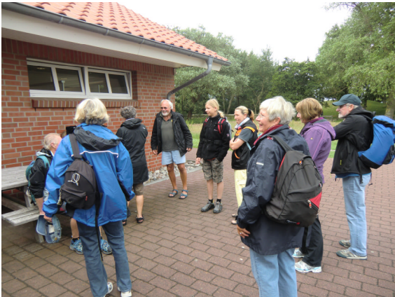
Die Gruppe am Nationalparkhaus auf Neuwerk

Nach dem Mittagessen stand bis 15.30 Uhr die Zeit zu freien Verfügung. Bei dem üblichen Inselrundgang merkten wir, dass es stark aufgebrist hatte. Das Wasser war sehr schnell aufgelaufen und recht kabbelig. Trotzdem war die Rückfahrt mit der „Flipper“ sehr ruhig. Nach Ankunft in Cuxhaven wurde einhellig die Meinung vertreten, dass es trotz bedecktem Wetter und reichlich Wind ein schöner Tag war.