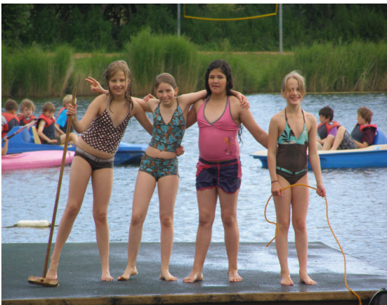
Wassernixen ausnahmsweise mal an Land