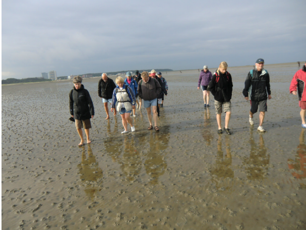
Die Gruppe beim Abmarsch in Sahlenburg

Zu der traditionellen Neuwerkwanderung der Skigruppe hatten sich 16 Teilnehmer angemeldet. Am Samstag, den 18. Juni 2011, gegen 08.00 Uhr wanderten wir von Sahlenburg aus los. Das Wetter war leicht bedeckt und es wehte nur wenig Wind. So konnten wir ziemlich flott