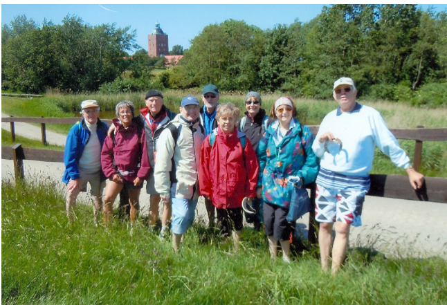
Ein Schönwetter- Foto zum Beweis!

Dafür waren aber die Priele schön leer und völlig ohne Schwund (man sagt doch: ein wenig Schwund ist überall) erreichten wir wieder das Festland in Duhnen.