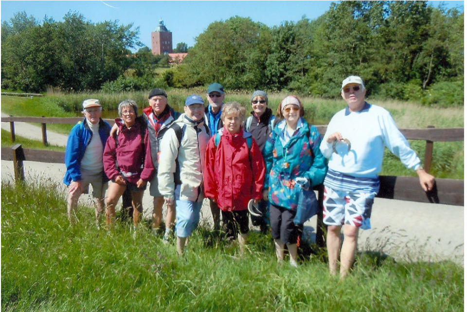
Neuwerkwanderung der Er & Sie - Gruppe

Allgemeiner Turn- und Sportverein Cuxhaven von 1862 e.V.