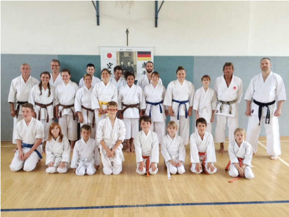
Die Karatekas waren k.o., aber rundum zufrieden!