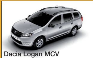
Dacia Logan MCV