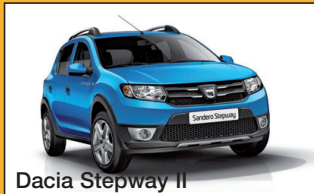
Dacia Stepway II