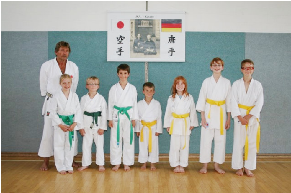
Strahlende Gesichter bei den erfolgreich geprüften Kindern!