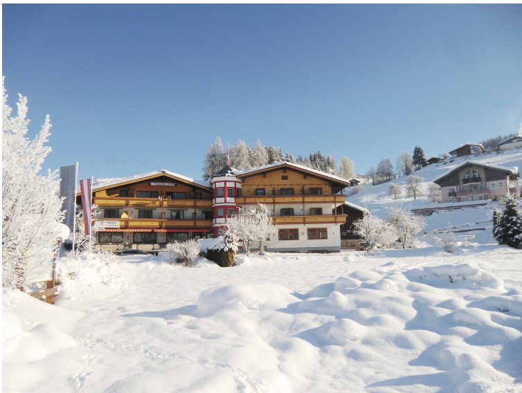
Bei so einer winterlichen Kulisse schlägt das Skifahrerherz gleich höher!

Die Anmeldung muss bis zum 14. Oktober 2015 erfolgen.