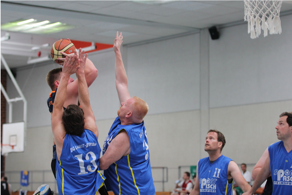
Sehr gute Verteidigungsarbeit bei den Gästen aus NRW