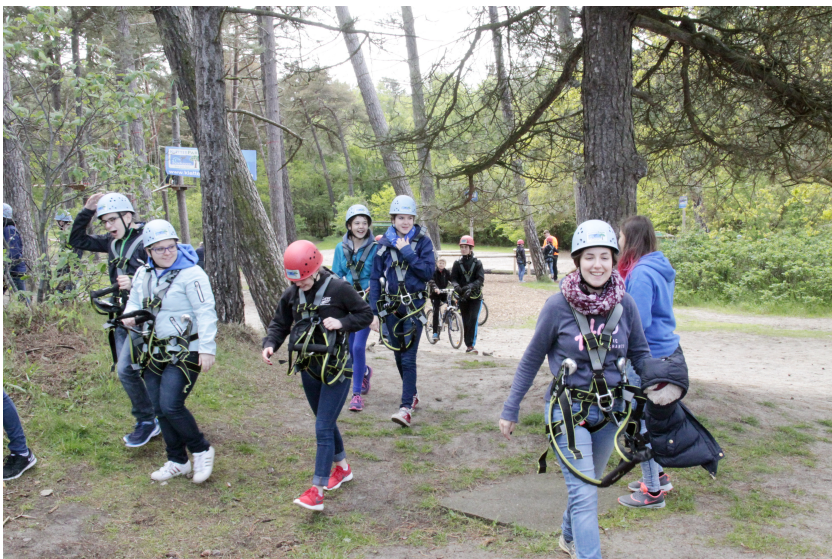
Das Klettern im tollen Sahlenburger Kletterpark ist richtig anstrengend, aber bringt enorm viel Spaß!