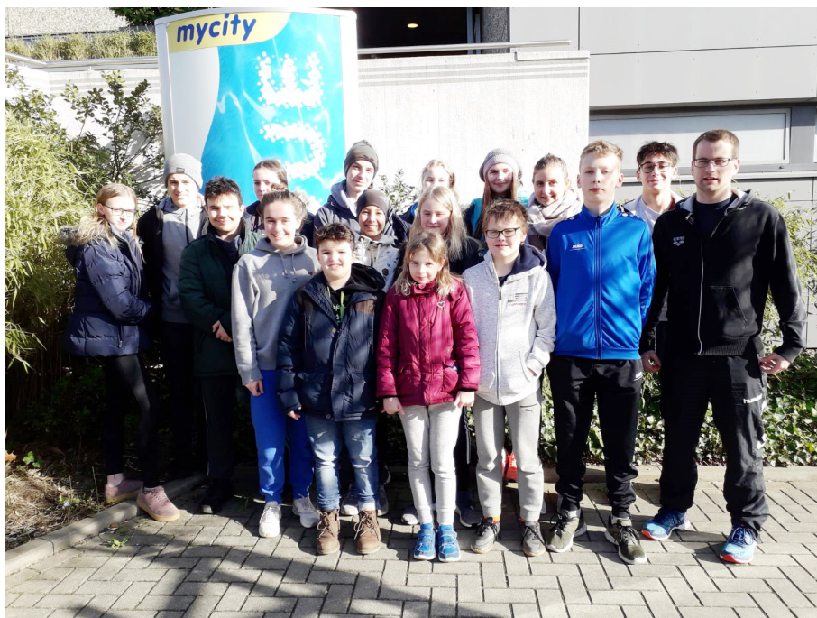
Auf nach Uelzen zur Bezirksmeisterschaft!