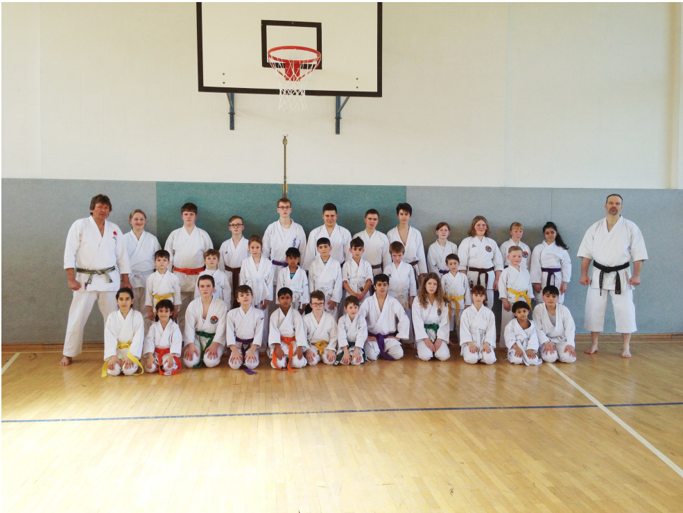
35 Karatekas aus Cuxhaven und umzu.