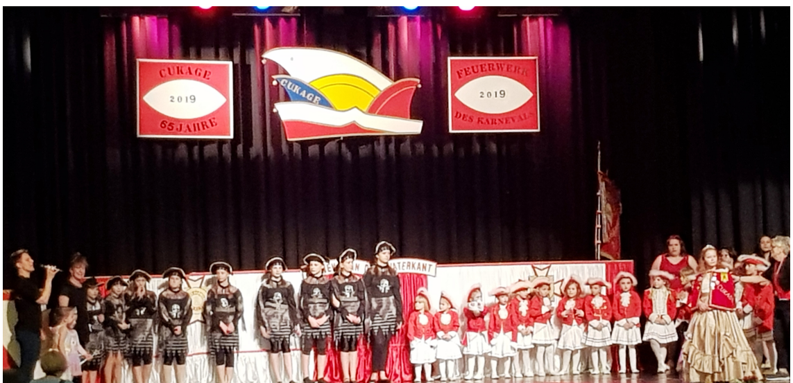
Auch 2019 wieder zu Gast bei der CuKaGe.