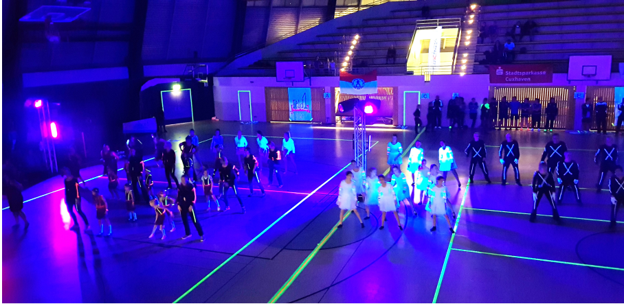
Mal was ganz anderes: eine Schwarzlichtshow in der Rundturnhalle!