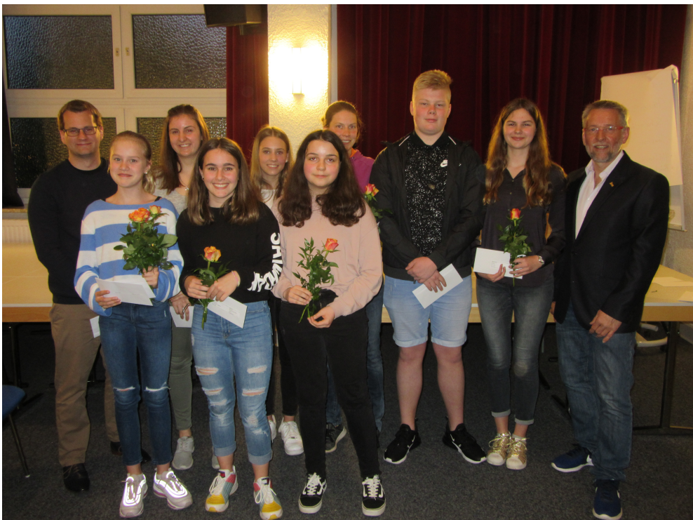
Die erfolgreichen Schwimmer des Jahres 2018/2019.