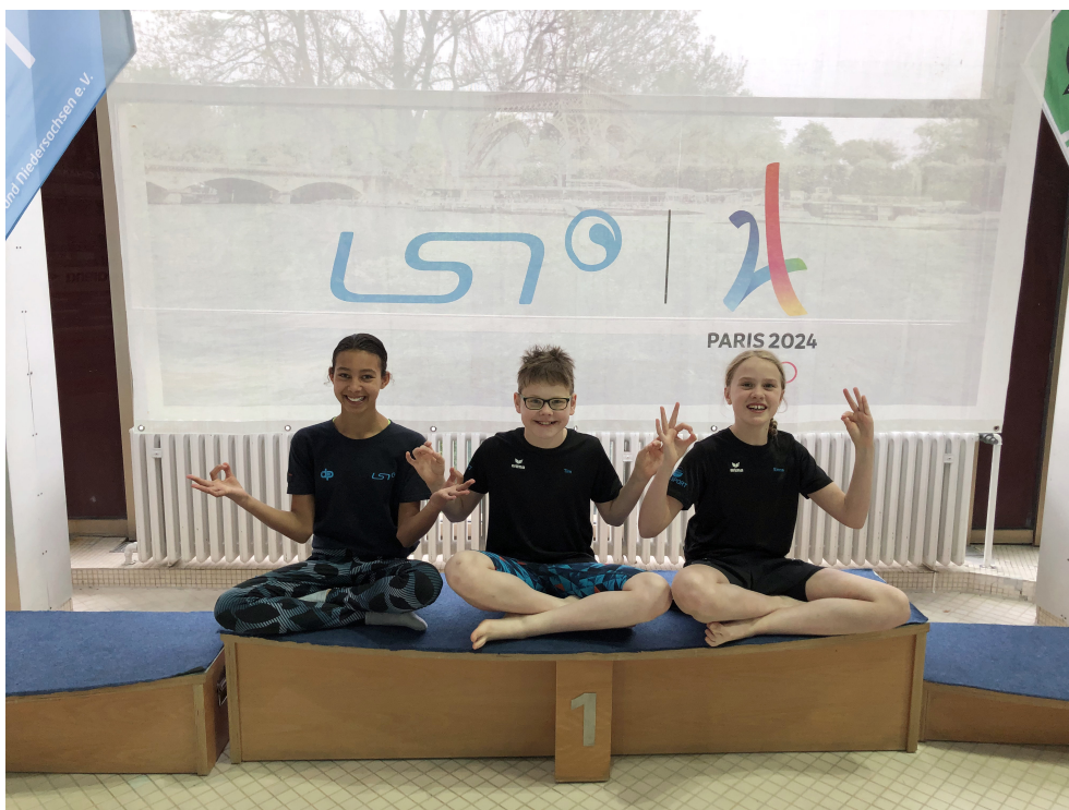
Yoga: Konzentration vor den Wettkämpfen?