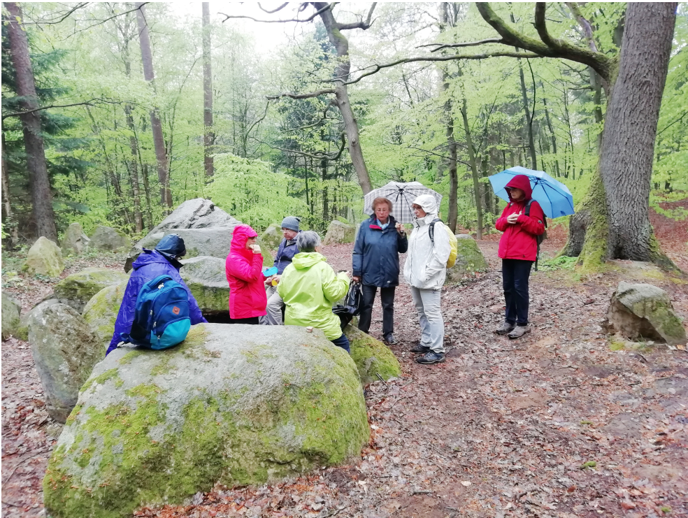
Das Baumdach des Waldes hat leider nicht den ganzen Regen abgehalten.