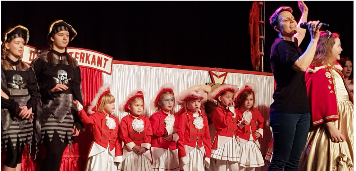
Alle Späße verstehen die Kleinen noch nicht, aber sie wollen ja nur eines: Tanzen!