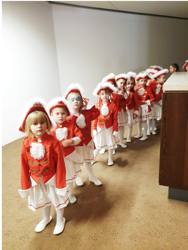
Fertig aufgestellt zum Einmarschieren!