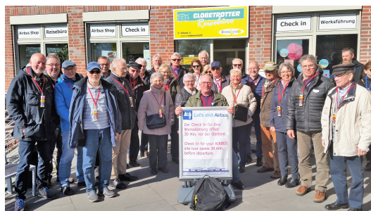
Die Jedermänner zu Besuch in Hamburg

Nach 2,5 Stunden Besichtigung ging es zu einer Gaststätte auf der Rückfahrtstrecke zum vorbestellten Mittagessen. Wieder angekommen in Cuxhaven fanden sich die Jedermänner um 20.00 Uhr vollzählig und pünktlich zu ihren geliebten beiden Sportstunden ein.