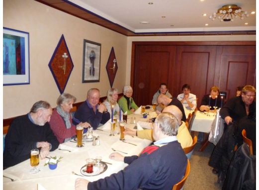
Das Warten auf den Grünkohl hat sich gelohnt...

Dem Jugendbereich muss man in der neuen Saison viel Aufmerksamkeit schenken, damit man den Verlust der jungen Herrenspieler bald ausgleichen kann.