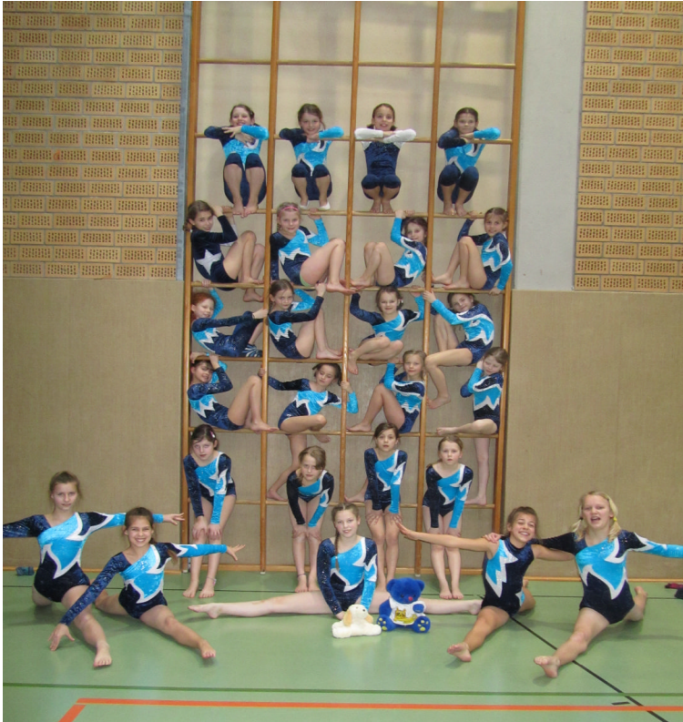
Die kleinen ATSC-Kunstturnerinnen

Allgemeiner Turn- und Sportverein Cuxhaven von 1862 e.V.