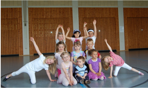
Mini- Wettkampf- Gruppe 1 4-6 Jahre