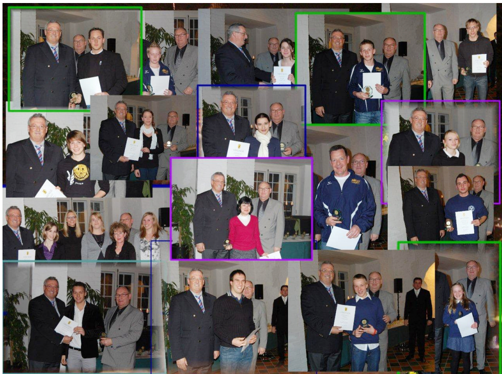
Unsere geehrten Sportler zu Gast bei Oberbürgermeister Arno Stabbert

Oberbürgermeister Arno Stabbert zeigte den hohen Stellenwert, den der Sport in Cuxhaven genießt mit der Angabe, dass rund 21 000 Sportler in 43 Vereinen aktiv sind. Er dankte allen Trainern, Jugendwarten und allen, die in irgendeiner Form zu den sportlichen Erfolgen der zu Ehrenden beigetragen haben.