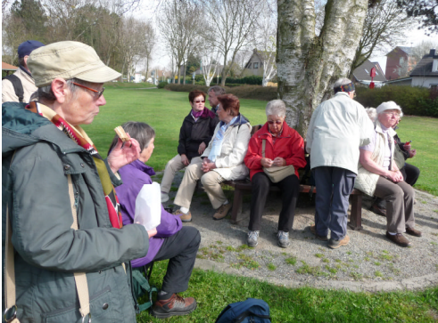
Rast aus dem Rucksack