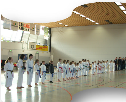
Die Starter der Disziplin Kihon