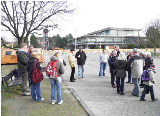
Treffpunkt war wie immer der Wochenmarktplatz