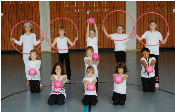
Wettkampf- Gruppe 2 6-7 Jahre