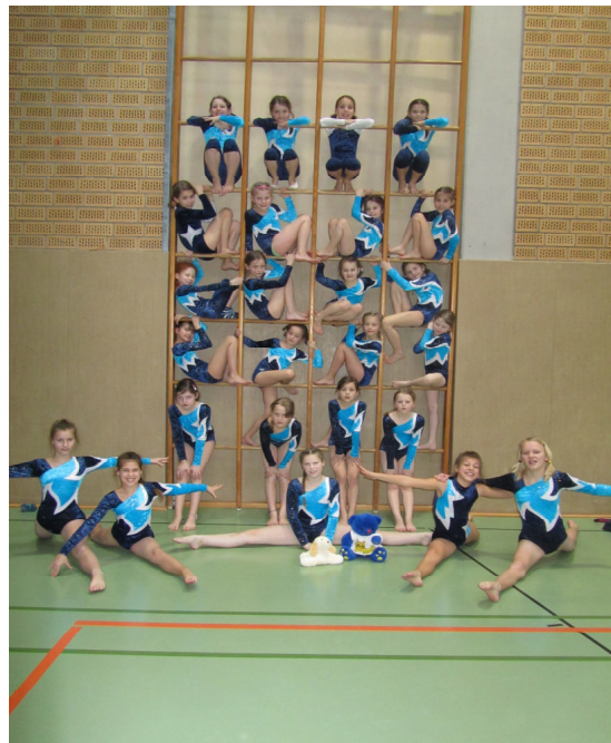
Ein schönes Bild: Die ATSC-Kunstturnerinnen