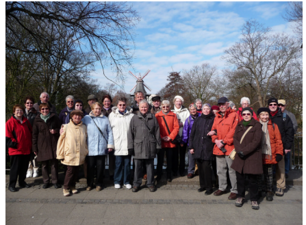
ATSC-Wanderguppe mit Gästen in Bremen

Kaffeekönigs Roselius mit den expressionistischen Bauten Höttgers führte der Rückweg. Schon 1935 (!) wurde diese Gasse von der damaligen großdeutschen Regierung unter Denkmalschutz gestellt. Hitler wollte sie als „Mahnmal gegen den Kulturbolschewismus“ erhalten wissen. Übrigens ein wiederum beachtlicher Schachzug der Bremer!