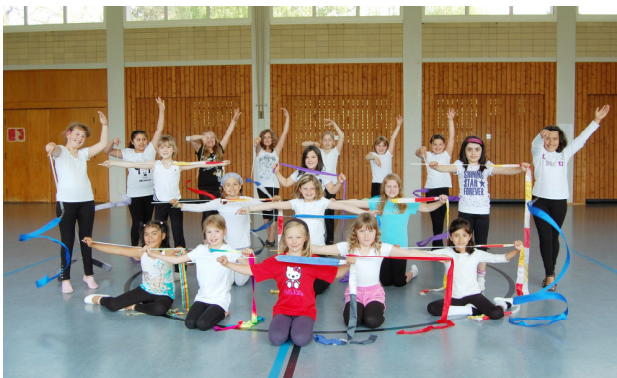
Wettkampf- Gruppe 3 8-10 Jahre