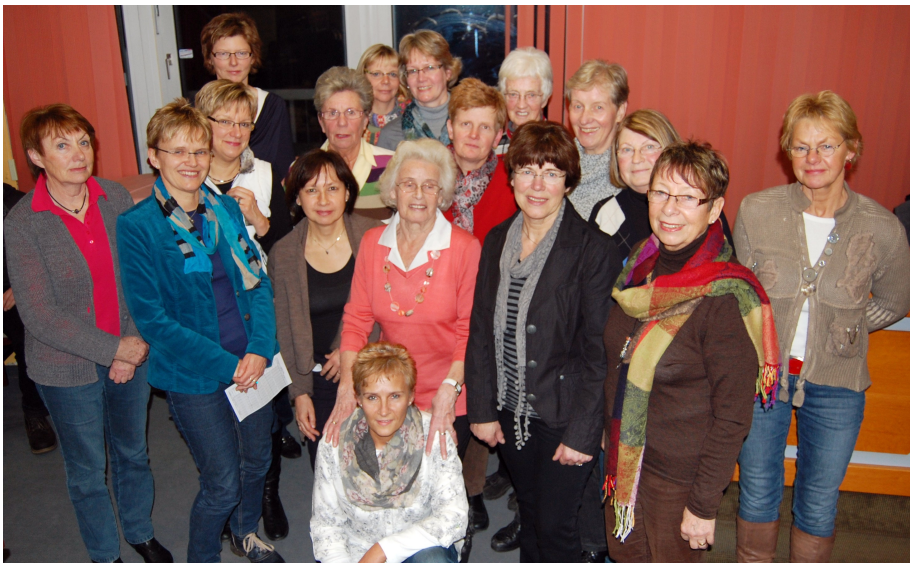
Die erfolgreichen Frauen