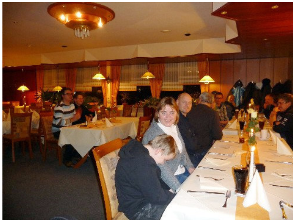
Der Grünkohl kann kommen