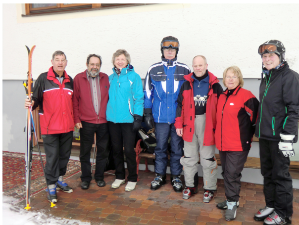
Die Teilnehmer der Skifreizeit