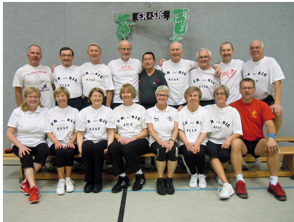
Die „Er und Sie - Gruppe“