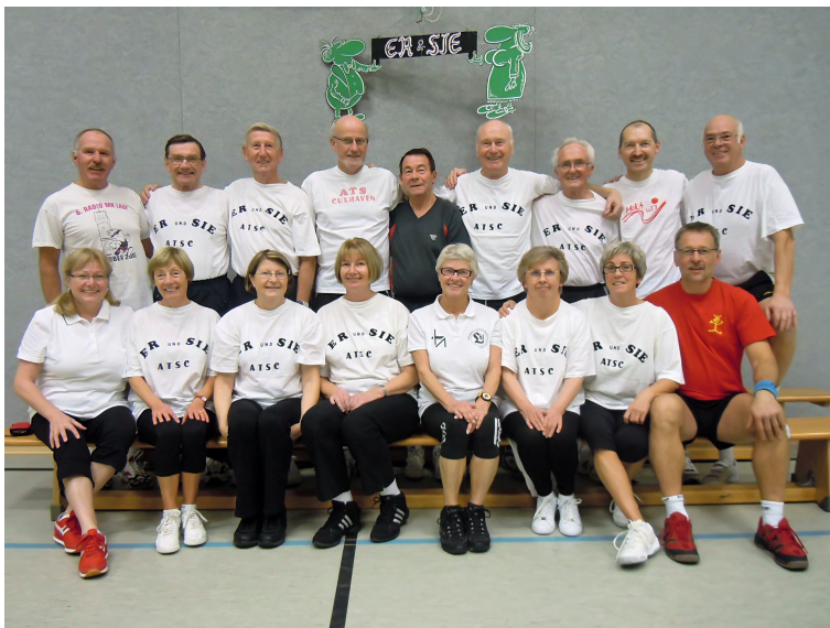
Die „Er und Sie - Gruppe“