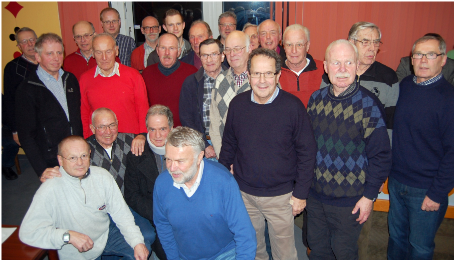
Die erfolgreichen Männer