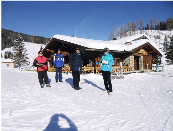
Langläufer und Wanderer auf der Gnadenalm