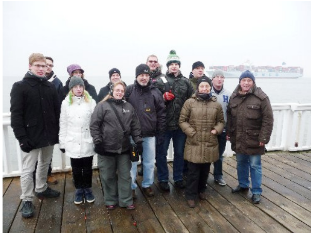
Kurze Rast an der „Alten Liebe“