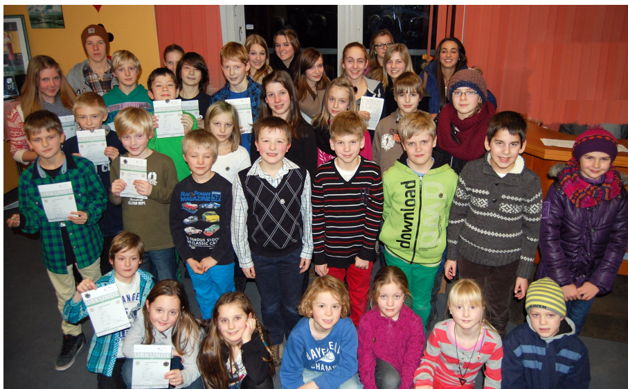
Die erfolgreichen Kinder/Jugendlichen