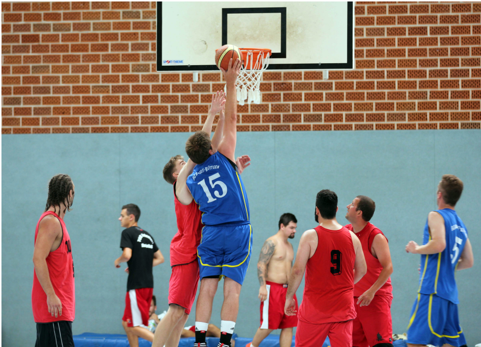
Beim Kampf um den Ball waren die Spieler der BG Kaarst/Büttgen oft erfolgreich und sicherten sich verdient den Turniersieg.