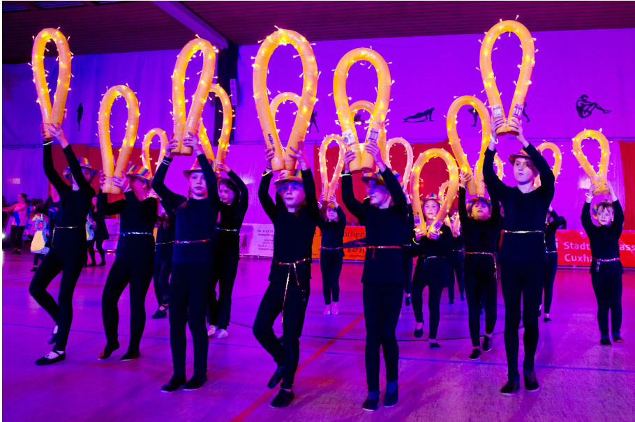
Die beleuchteten Nudeln und Leuchtgürtel wirkten in der dunklen Halle besonders gut und zogen alle Blicke auf sich.