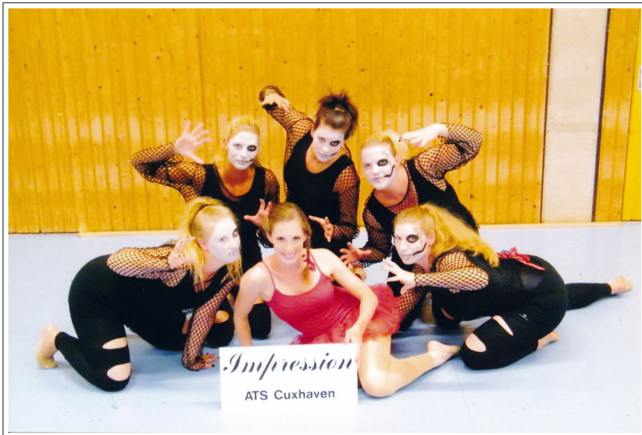
Die 1. Damen ist wieder erfolgreich.