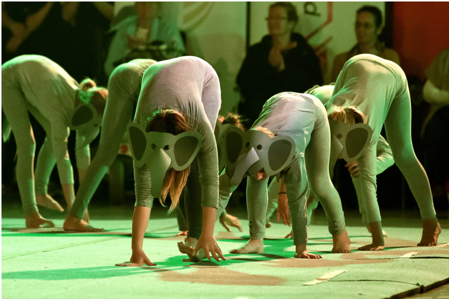
Die Dschungelbuchpatrouille absolvierte ihren Einmarsch in die abendliche Rundturnhalle.