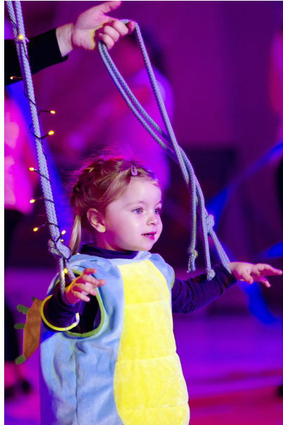
Kostüme und Choreographie der Kleinsten waren wieder einmal zu niedrig.