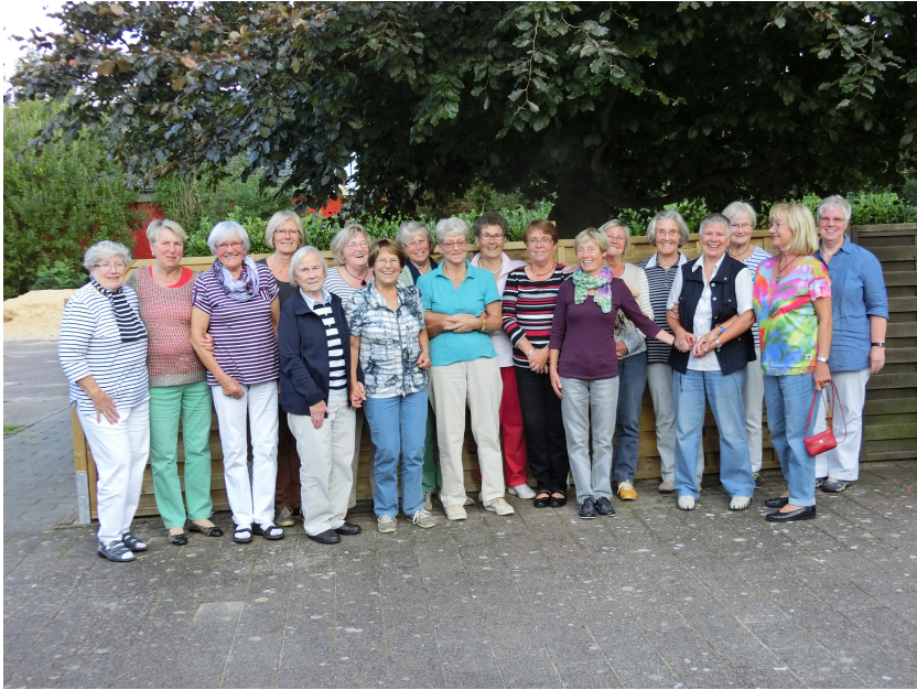
Die lustige Truppe der sportlichen Mittwochsdamen