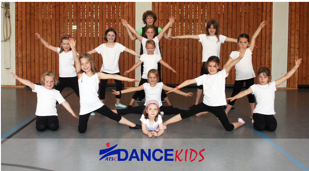
Die Mädels stehen zwar noch am Anfang, aber das Gruppenbild wirkt doch schon sehr professionell!

Na, dann mal los und viel Spaß beim zukünftigen Wettkampftraining!