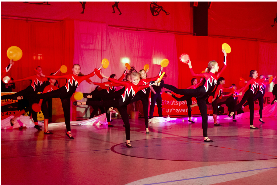
Die kleinen Wettkampftänzerinnen waren mit Eifer dabei.