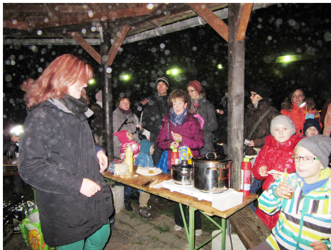
Das ATSC-Team versorgte seine Laternenläufer mit warmen Getränken und Würstchen

Nach dem gemütlichen Beisammensein waren sich alle einig, dass die gelungene Veranstaltung im nächsten Jahr auf jeden Fall wiederholt werden soll.