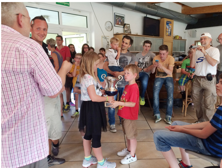
Die Kleinsten nehmen den Pokal in Empfang.

Es war wieder ein super tolles Wochenende und man freut sich auf ein Wiedersehen im nächsten Jahr.