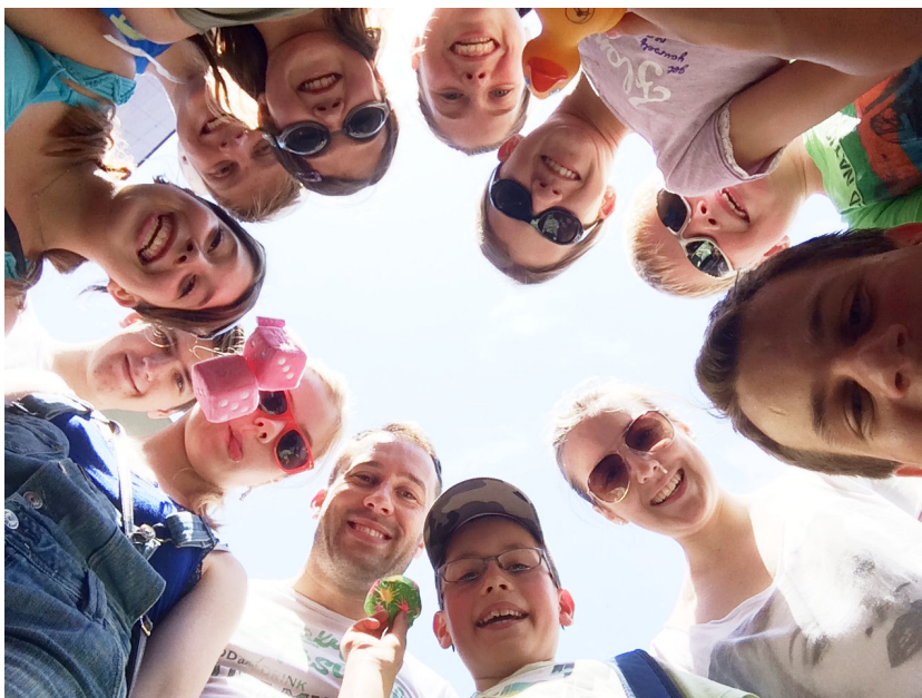
Die Gummersbacher hatten jede Menge Spaß!